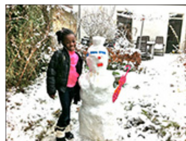
Winter in de tuin bij Huize Agnes

Hoera! In mei beviel een bewoonster van een gezonde zoon en in februari beviel onze extern wonende gast van een eveneens gezonde dochter.